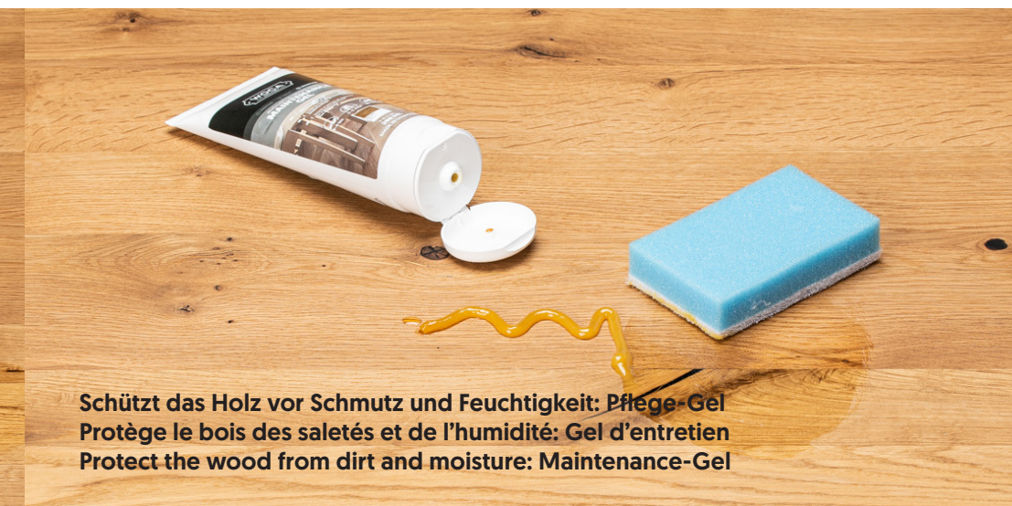
Schützt das Holz vor Schmutz und Feuchtigkeit: Pflege-Gel Protège le bois des saletés et de l'humidité: Gel d'entretien Protect the wood from dirt and moisture: Maintenance-Gel