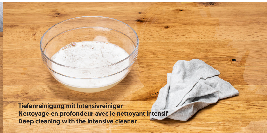
Tiefenreinigung mit Intensivreiniger Nettoyage en profondeur avec le nettoyant intensif Deep cleaning with the intensive cleaner